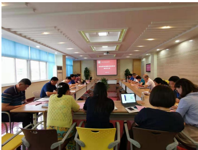
学校第四届学术委员会成立大会暨第一次全体委员大会胜利召开