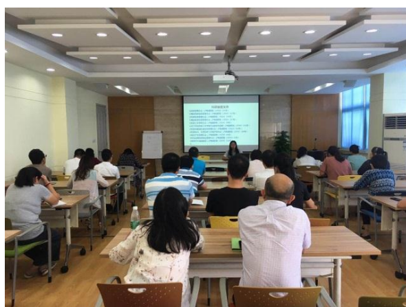
科研制度与管理规范培训会(二)