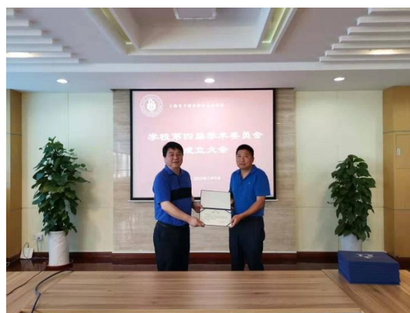
学校第四届学术委员会成立大会暨第一次全体委员大会胜利召开