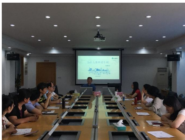
科研经费使用推进会