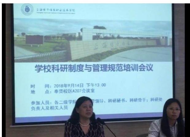
科研制度与管理规范培训会(一)

同时，科研处在政策允许的最大范围内为科研项目争取配套资助和奖励，并积极开拓思路，不断完善工作方式方法，在制度执行过程中带有温度和感情，努力为学校教师和科研人员创设优良的制度环境，使其能够安心科研、潜心育人。（科研处 张迎春供稿）