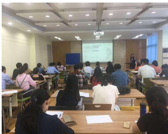
知识产权及相关政策专题培训